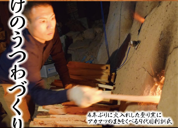
4年ぶりに火入れた登り窯にアカマツのまきをくべる9代目利訓氏