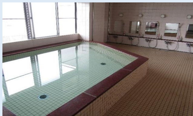
大浴場は5階にございます