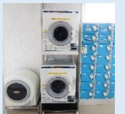
洗濯機・乾燥機は無料です