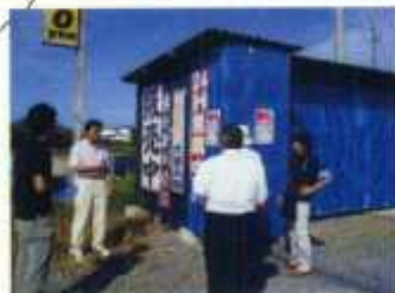
自動販売機の巡回調査の様子 (いわき市)